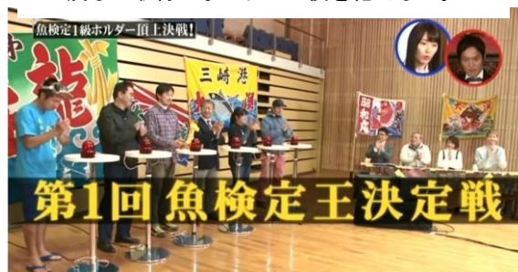
フジテレビの正月特番。ととけん1級ホルダー6名による頂上決戦をオンエア。

聞けば、秋田の産地イメージが強いハタハタ(当地ではブリコを持たないシロハタ)の認知を大消費地で高めたい、加えて県外から受検者、なかでも消費地市場の関係者をこの機に鳥取に呼びたい、とのことでした。結局、第2回は東・阪に加え鳥取市と境港市で開催、鳥取県は観光協会などとも連携され、現地視察ツアーを受検日前日から組まれるという力の入れようでした。これ以降、開催地は全国に広がり、昨年まで28市町が、魚や食の町づくりなど地域活性化を目的に地方誘致されています。